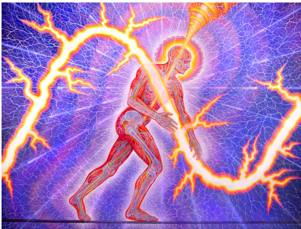
"Lightworker" by Alex Grey, 2010